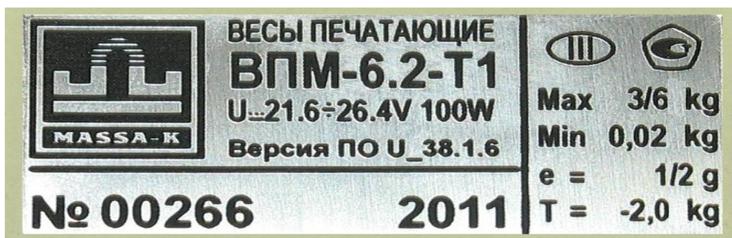
Рисунок 5 – Маркировка весов

Маркировка весов производится на фирменной, разрушающейся при снятии планке (рис. 5). На которой нанесено: