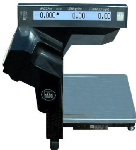
а) без автоматической подмоткой ленты устройства печати этикеток.