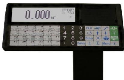
TR(H) (системные печатающие с автономным питанием)