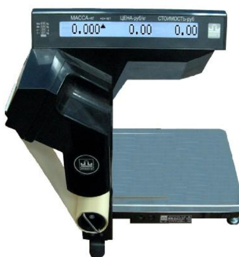
б) с автоматической подмоткой ленты устройства печати этикеток.