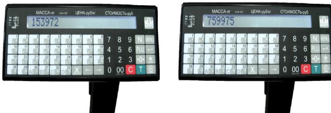
Рисунок 3 – Пример смены показания счетчика при последующей юстировке

1) Весы снабжены программным двадцатичетырехразрядным несбрасываемым счетчиком, показания которого меняются случайным образом автоматически при каждой юстировке (рис. 3). Генератор случайных чисел выдает случайное число. Данное число при юстировке записывается в цифровой весоизмерительный датчик. При замене или при повторной юстировке датчика повторить это число невозможно. Для контроля показаний счетчика (кода юстировки) включают весы и во время прохождения теста нажимают и удерживают нажатой кнопку МЕНЮ до появления сообщения «Параметры». Нажатием кнопок ← , → входят в меню «Код калибровки». Нажимают ↵ . На индикаторе отобразится код юстировки.