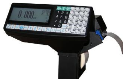
TR(P) (системные печатающие)