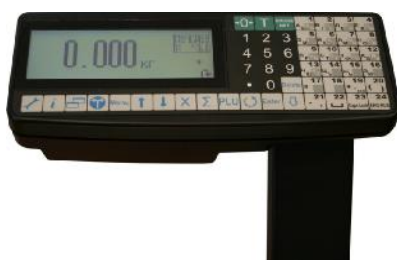
TR (системные с автономным питанием)