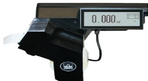
TR(TP) (системные печатающие с двухсторонней индикацией)